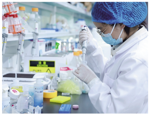
研究人员在实验室。

此外，研究团队利用蛋白质结构预测和虚拟筛选技术，从 7000 余种小分子化合物中成功找