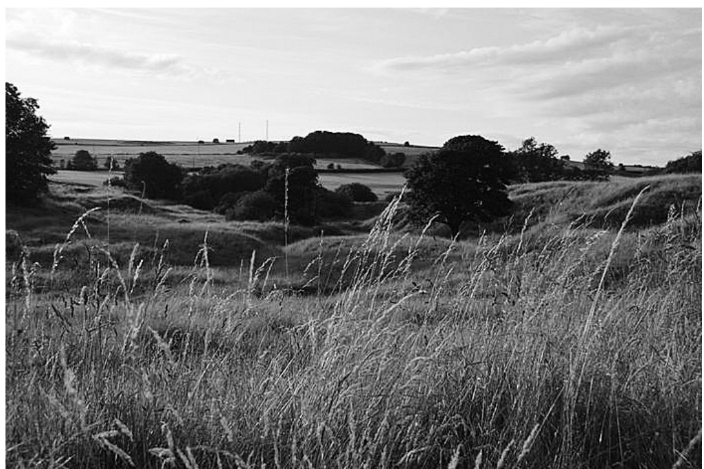
被杂草覆盖的古罗马时代铅矿遗址。