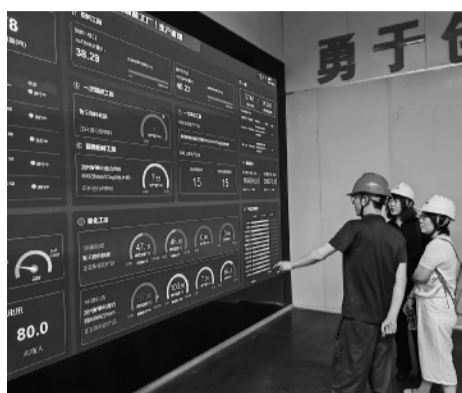
“中农科龙腾”软件在大型饲料企业进行公益性应用示范。