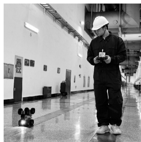
柔性八轮巡检机器人在水电站应用。

与会专家认为,明绿节能供暖机立足用户实际需求,采用新型加热材料、新型结构、变频、快速快出换热、防水垢、小型模块化、智能控制等技术,实现了供热系统的节能运行。经权威检测,明绿节能供暖机能效结果优异,5194平方米供暖面积平均热功率仅60千瓦时,平均热效率99.24%。该供暖机在最低气温零下20摄氏度的条件下进行过严苛测试。该成果拥有多项发明专利,已进行科研成果转化并实现量产。