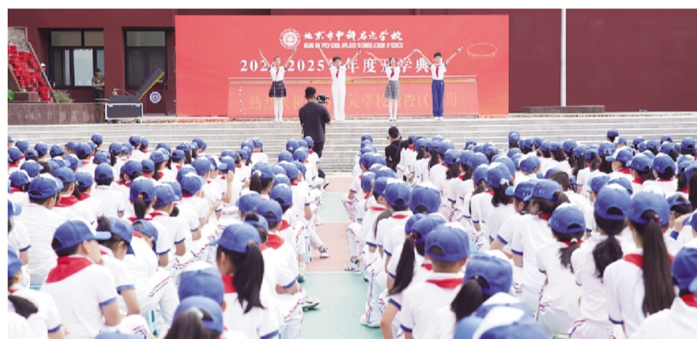
开学典礼现场。

本报讯(见习记者戚金葆)9月1日上午,北京市中科启元学校 2024—2025 学年度开学典礼在新启用的校区举行。中国科学院副院长、党组成员汪克强出席典礼并讲话,相关单位代表以及学校 1300 多名师生参加典礼。