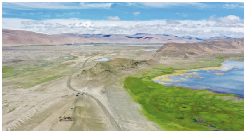
左侧为几近干涸的嘎拉错,右侧为水域面积不到 1.5 平方公里的玛不错。

近日,兰州大学教授杨晓燕团队发表于《自然-生态与演化》的研究发现,早在 4400 年前,青藏高原的本土人群就在玛不错湖畔形成了以湖泊为中心的定居生活方式。这一发现为确定人类定居高原的时间与方式提供了重要线索。